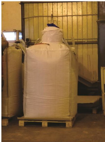
San Salvador, Entre Rios, Argentina - Julio 2020