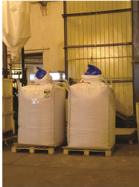
Registro fotográfico tomado y armado por M. Evangelina Malarin - Perito Clasificador de Granos. San Salvador, Entre Rios, Argentina - Julio 2020