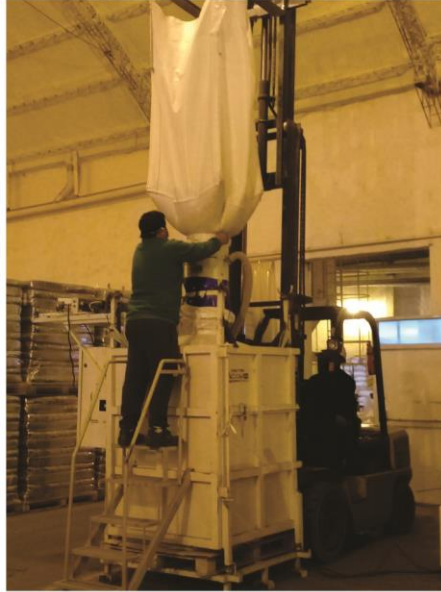
Registro fotográfico tomado y armado por M. Evangelina Malarin - Perito Clasificador de Granos. San Salvador, Entre Rios, Argentina - Julio 2020