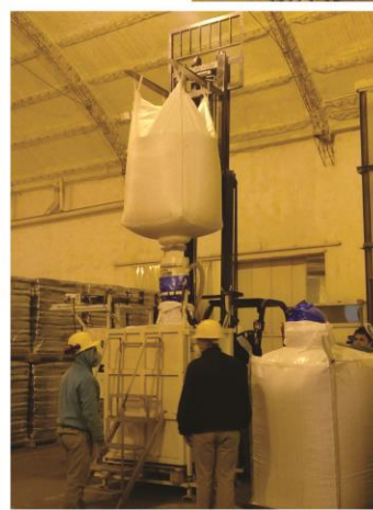
Registro fotogr fico tomado y armado por M. Evangelina Malar n - Perito Clasificador de Granos. San Sabador, Entre R os, Argentina - Julio 2020