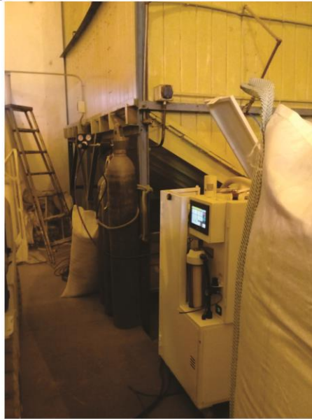
Registro fotográfico tomado y armado por M. Evangelina Malarin - Perito Clasificador de Granos. San Salvador, Entre Rios, Argentina - Julio 2020