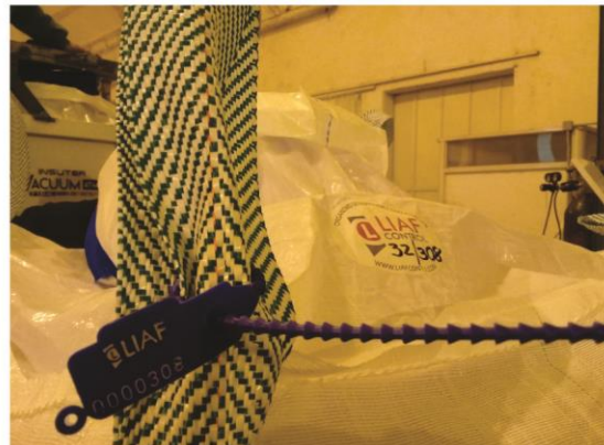
Registro fotográfico tomado y armado por M. Evangelina Malarin - Perito Clasificador de Granos. San Salvador, Entre Rios, Argentina - Julio 2020