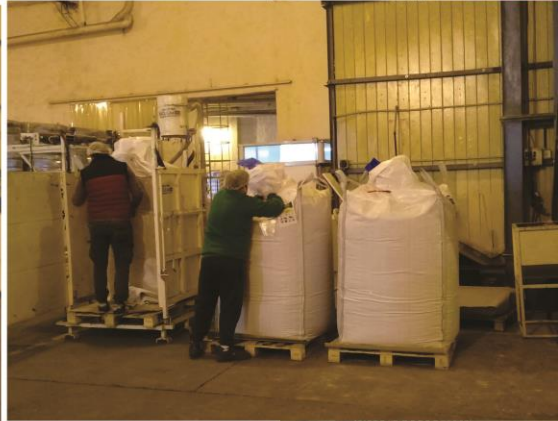
Petite Clasificador de Granos. San Salvador, Entre Rios, Argentina - Julio 2020