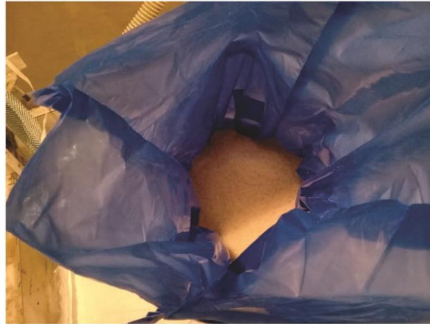
San Salvador, Entre Ríos, Argentina - Julio 2020