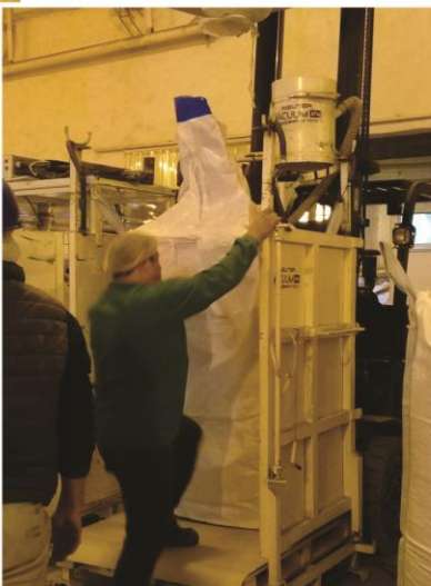
San Salvador, Entre Ríos, Argentina - Julio 2020