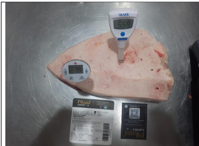
EMPAQUE PRIMARIO TAPA DE CUADRIL