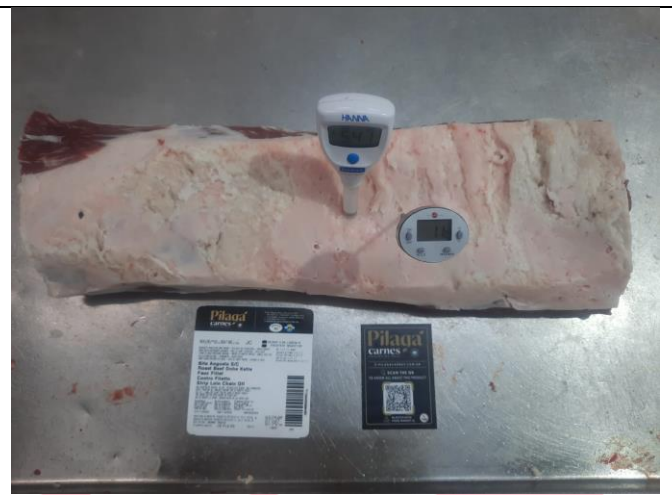
EMPAQUE PRIMARIO Y SECUNDARIO TAPA DE CUADRIL