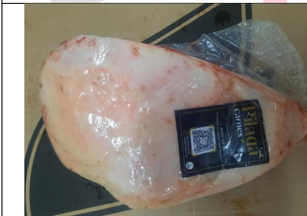
ROTULADO EMPAQUE SECUNDARIO BIFE ANCHO