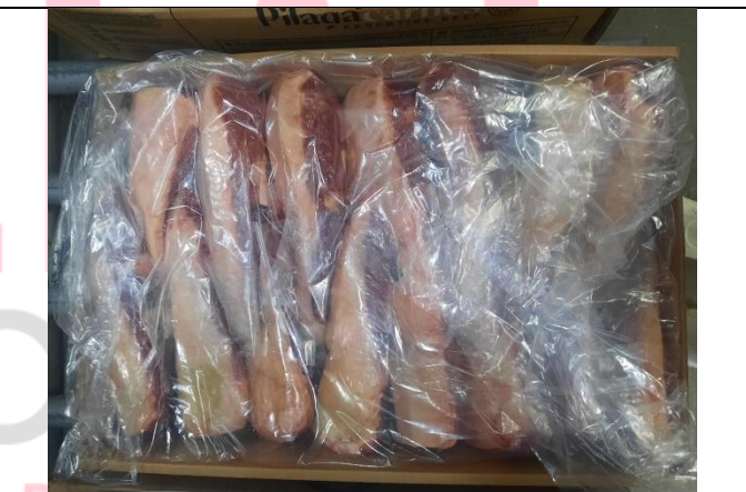
ROTULADO EMPAQUE SECUNDARIO LOMO